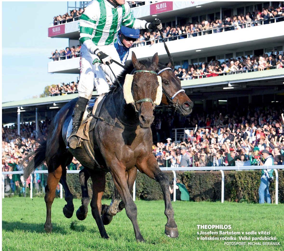
THEOPHILOS s Josefem Bartošem v sedle vítězí v loňském ročníku Velké pardubické.

8. Jezdkyně Martina Růžičková se do cíle Velké pardubické dostala až na šestý pokus ve svých padesáti letech. Se kterým koněm si sen splnila?